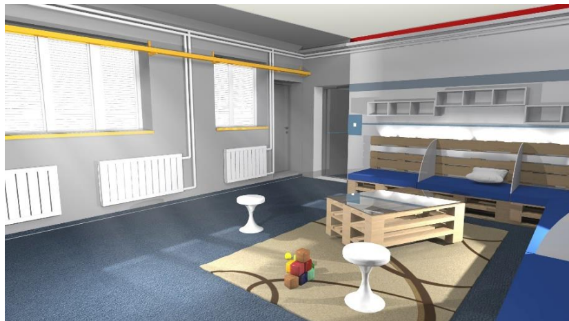
Vizualizace největší z místností Metra